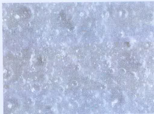
Foto 3: Untersuchungsmaterial RAKU-PUR 32-3276, Hellgrau nach einer Inkubationszeit von 28 Tagen ohne Pilzwachstum (50fach vergrößert)